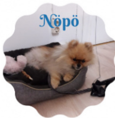
Kirpputorin vapaaehtoisia ja Nöpö

Vieraile kirpputorilla ja sen verkkosivuilla